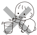
やけど・けがなど危険。